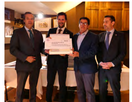
Entrega de premios